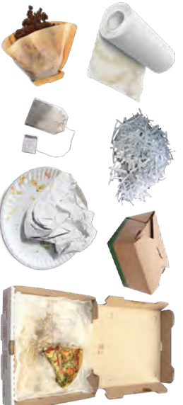
PRODUCTOS DE PAPEL SUCIOS SIN RECUBRIMIENTO DE PLÁSTICO