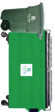
PRODUCTOS COMPOSTABLES CERTIFICADOS POR BPI