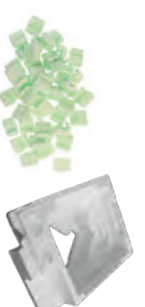
ESPUMA DE POLIESTIRENO: ENVASES, ENVASES DE COMIDA, EMBALAJE DE MANÍ