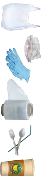
BOLSAS DE PLÁSTICO, ENVOLTURAS DE PLÁSTICO Y VASOS RECUBIERTOS DE PLÁSTICO