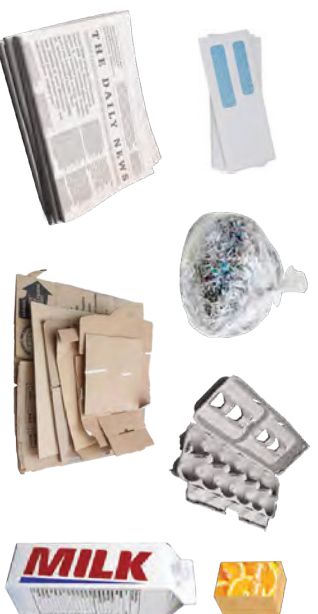
PAPEL LIMPIO, PAPEL TRITURADO Y CAJAS ASÉPTICAS (E.G. LECHE, JUGO)

Ponga papel triturado en una bolsa transparente, o tirelo libremente en su contenedor de orgánicos.