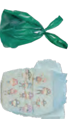
RESIDUOS DE ANIMAL EMBOLSADOS Y PAÑALES