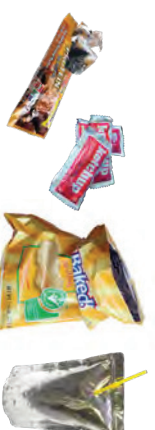
BOLSAS DE MERIENDA, JUGOS, Y ENVOLTORIOS