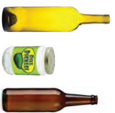
BOTELLAS Y FRASCOS DE VIDRIO