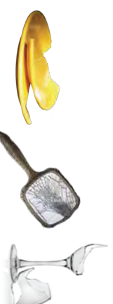
CERÁMICA ROTA, ESPEJOS, Y VIDRIO DE VENTANA